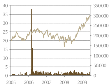
Cierre y Volumen (MMUS$)